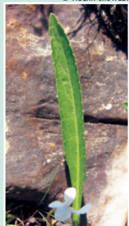
Feuille étroite et en forme de lance