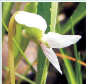
Fleur vue du bord