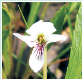
Fleur vue d'en avant